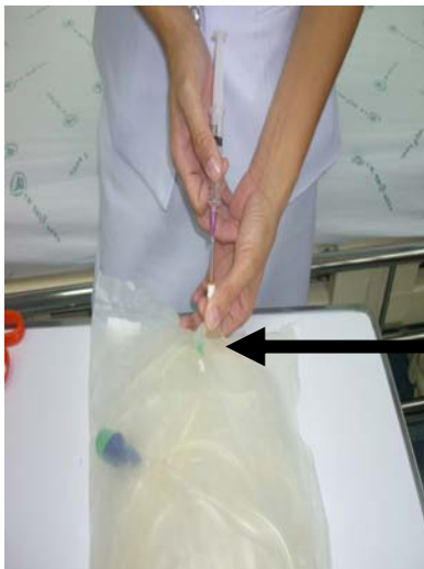
บริเวณฉีดยาปฏิชีวนะ