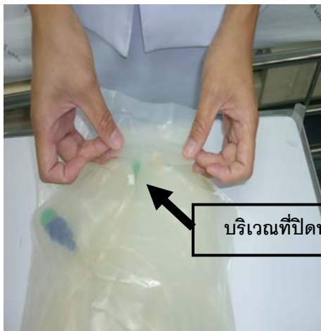
บริเวณที่ปิดพลาสติก